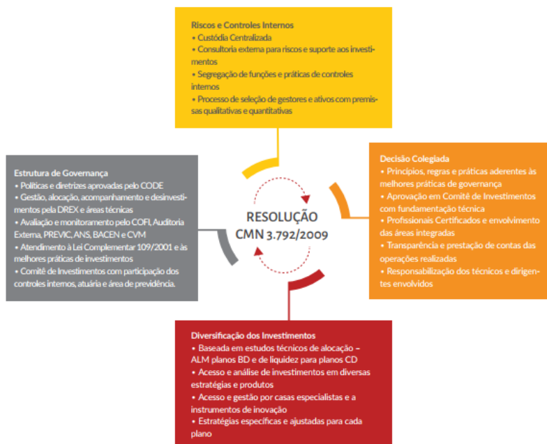
Diagrama 1 – Processo Decisório de Investimentos

Abaixo é apresentado fluxograma do Processo decisório de Investimento da Fundação.