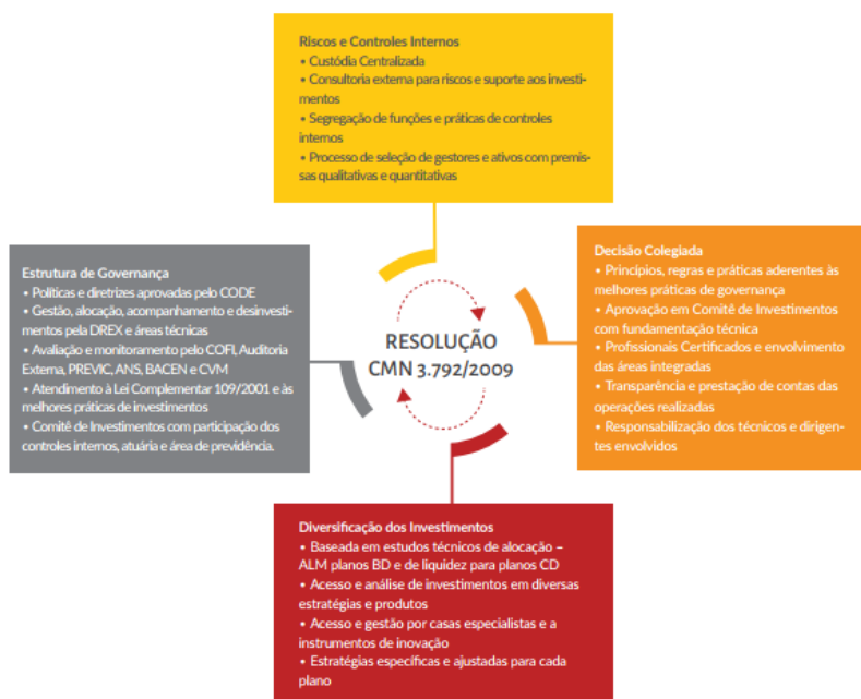
Diagrama 1 – Processo Decisório de Investimentos

Abaixo é apresentado fluxograma do Processo decisório de Investimento da Fundação.