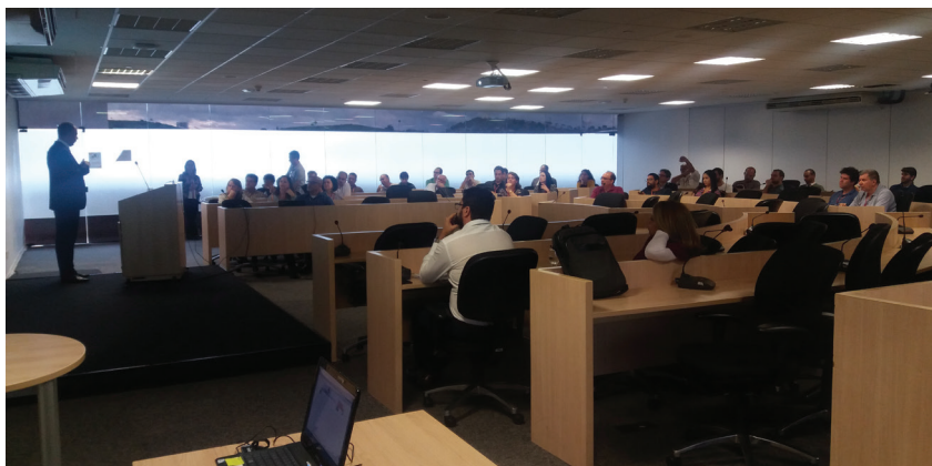
Prestação de Contas no Sindágua MG (acima) e na Prodemge